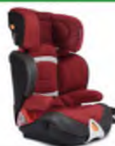
Автокресло группы III