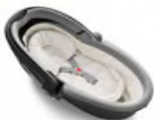
Автокресло «люлька» группы 0

Детские удерживающие устройства подразделяют на 5 весовых групп: