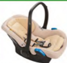
Автокресло группы 0+