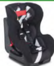
Автокресло группы I