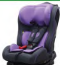
Автокресло группы II